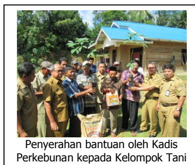
Penyerahan bantuan oleh Kadis Perkebunan kepada Kelompok Tani