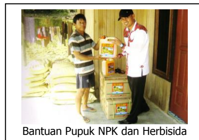
Bantuan Pupuk NPK dan Herbisida