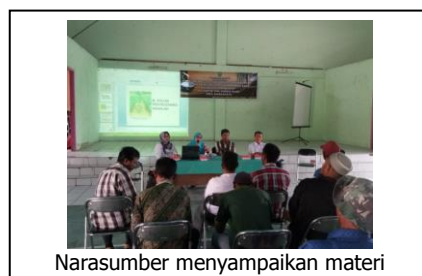
Narasumber menyampaikan materi

Sosialisasi dilaksanakan pada tanggal 13 April 2017 selama 1 (satu) hari di Desa Margahayu Kecamatan Loa Kulu Kabupaten Kutai Kartanegara dengan peserta berasal dari kelompok tani yang mendapat bantuan pada tahun 2017 yang terdiri dari pengurus kelompok tani baik ketua, sekretaris maupun anggota kelompok tani sebanyak 30 orang. Narasumber berasal dari Bidang Pengembangan Dinas Perkebunan Provinsi Kalimantan Timur dan Petugas Lapang Kabupaten / Kota. Pertemuan menggunakan metode ceramah interaktif dalam bentuk tanya jawab, saling bertukar pendapat kepada peserta sosialisasi. Tim Pelaksana sosialisasi menjelaskan mengenai Spesifikasi Teknis dari masing-masing bantuan yang didapat dari petani, dan menginstruksikan serta mengharapkan agar petani telah mempersiapkan lahannya karena bantuan telah mulai disalurkan.