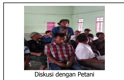
Diskusi dengan Petani