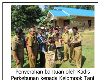
Penyerahan bantuan oleh Kadis Perkebunan kepada Kelompok Tani