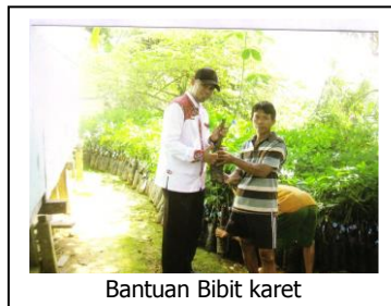
Bantuan Bibit karet